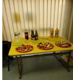
Assemblée générale 2012 de Contact Dordogne