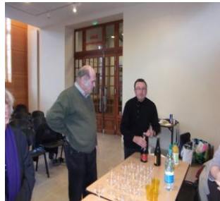
Assemblée générale 2012 de Contact Aquitaine